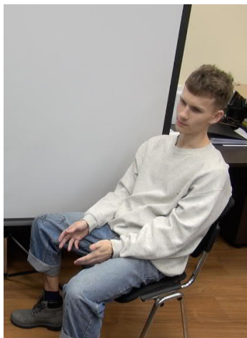
Рис. 2. Прагматический жест: Обычная история.

Не станем утверждать, что все выявленные шуточные высказывания были однозначно креативными. Однако при детальном рассмотрении можно констатировать, что элемент креативности присутствовал в большинстве эпизодов, в противном случае не был бы достигнут комический эффект.